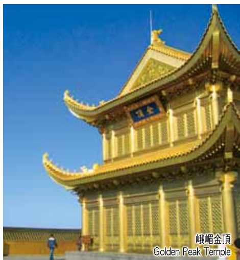
峨嵋山金頂 Golden Peak Temple

住宿：5★天頤溫泉酒店或同級 (早、午、晚餐) Arrive in Chengdu by flight to visit the Giant Panda Breeding Research Base. After lunch, coach to Leshan for a boat ride, during which all will be enchanted to a state of ecstasy when seeing the Giant Buddha, the carving of which actually took as long as 90 years during the Tang Dynasty. Standing at a majestic height of 71 meter by the river side, it is perhaps the biggest of its kind anywhere in the world. Coach to Mr. Emei for an overnight stay. (B/L/D)