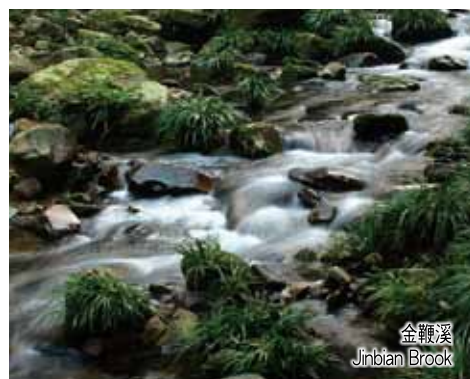
金鞭溪 Jinbian Brook

住宿：5★天下鳳凰酒店(主樓)或同級 (早、午、晚餐) Coach to Fenghuang, described as the most beautiful small town in China by a poet from New Zealand. After lunch, a boat ride tour skirting the town and a visit to the old home of Shecongwen will be provided. (B/L/D)