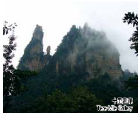
十里畫廊 Tere-Mile Gallery

早餐後乘車前往長沙國際機場，乘客機飛返原居地。 At the time specified, all will proceed to the airport for a home bound flight. (B)