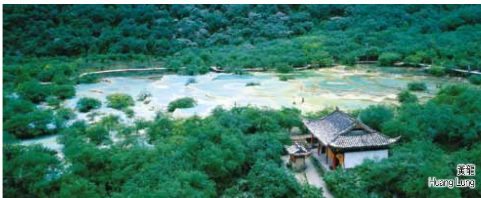
黃龍 Huang Long